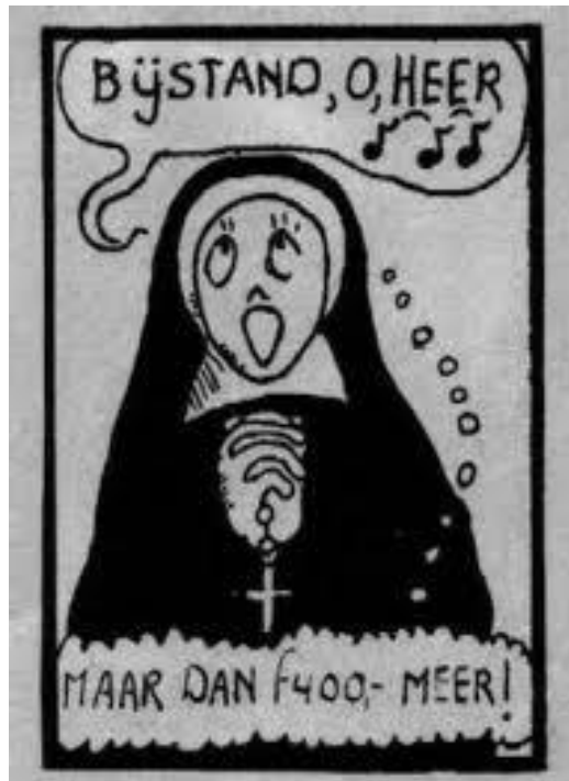
Aanvraagprocedure in 1965

Verslag afstudeeropdracht (AOD) Opleiding HBO-Rechten Hogeschool van Arnhem en Nijmegen